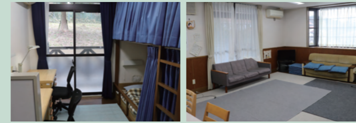
▲寮の部屋/思い思いにリラックスできる談話室で、仲間との交流も

学園生各自、談話室や和室で自由に活動。玄関ホール等では雑誌や漫画などを見ることができます。