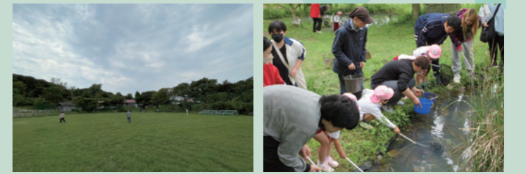
▲広場はのびのびと十分な広さ/ビオトープで近隣の保育園生と水生生物を観察

ビオトープで水生生物などの観察、天然芝の広場でサッカーや野球。学園内で出来ることは沢山あります。