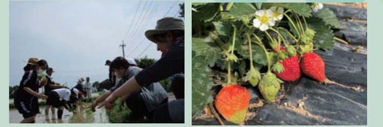
▲みんなでおこなった田植えの様子/ビニールハウスで実ったイチゴ

約2500平方メートルの広大な畑にビニールハウスを併設。入学1年目の学園生は全員農作業を体験します。自分たちで野菜の種をまき、育て、収穫。できた野菜はプログラムや食堂に提供し、学園内でおいしくいただきます。