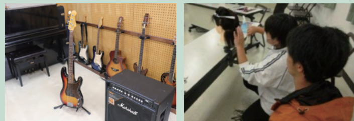
▲自由時間などにも使える音楽室/美容専門学校の先生をお招きし、体験活動