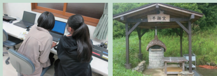
▲プログラム「情報デジタルアート」/ピザ窯でピザを焼く日も

本館は、プログラムや学園行事に使用。1週間のプログラムは好きなものを組み合わせられます。月曜の午前からプログラムを開始し、木曜の昼食後に帰宅する3泊4日の学園生活です（相談の上、個人に合わせて調整することも可能）。また、美術館や博物館・専門学校に訪問する体験活動も。進路相談やアルバイトなどの就労支援もおこなっています。