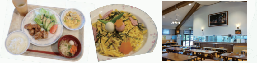
▲人気のからあげ定食/ひな祭りの日はちらし寿司も/食堂の内観

食堂には木調家具のテーブルや椅子が並び、グループや個人で食事がとれます。毎日、栄養バランスがとれた食事を用意。