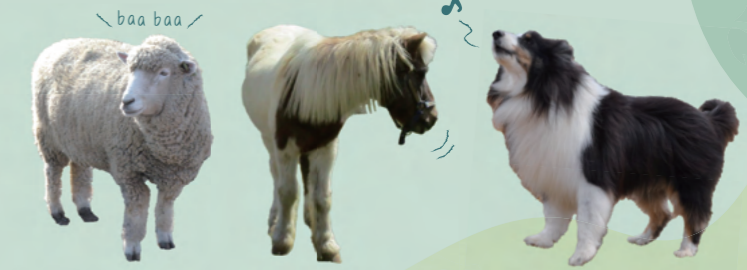
▲神出学園の動物たち。ほかにも、うさぎなどが学園生を待っています

神出学園では、放牧場で様々な動物が過ごしています。学園生は、日々のお世話をしたり、羊の毛を刈ったりします。